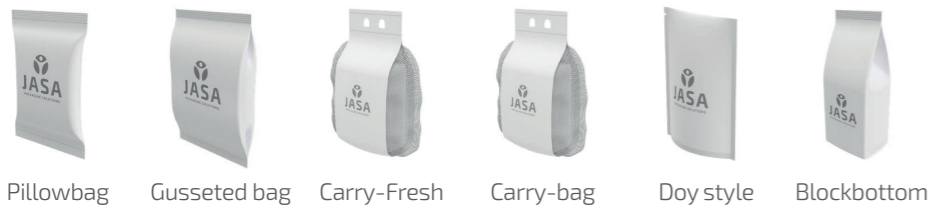
Pillowbag Gusseted bag Carry-Fresh Carry-bag Doy style Blockbottom