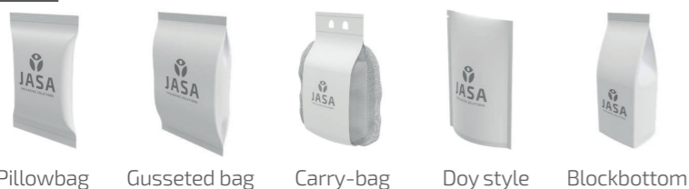
Pillowbag Gusseted bag Carry-bag Doy style Blockbottom